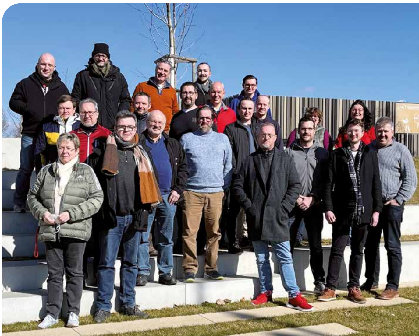
Bei einem zweitägigen Schießsport-Leiterlehrgang in Ruit holten sich die Teilnehmerinnen und Teilnehmer neue Impulse für den Schießsport

Nach zwei intensiven Tagen ging ein höchst interessanter und informativer Lehrgang zu Ende. Die Teilnehmerinnen und Teilnehmer kehrten mit frischem Wissen und innovativen Ideen in ihre Vereine zurück. (ih/mm/sl)