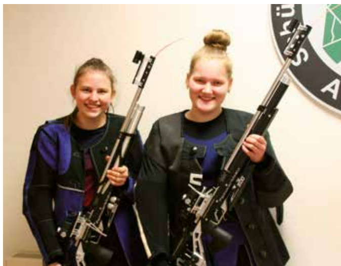
Beim Schützenverein Crailsheim-Jagstheim waren zwei Schießsportlerinnen mit dem Luftgewehr am Start

In den Disziplinen Luftgewehr und Luftpistole wird der Shooty Cup als Mannschaftswettbewerb für die Schülerklasse durchgeführt. Anders als sonst muss in diesem Jahr auf die Austragung in Ruit verzichtet werden, zumal das Risiko aufgrund der sehr hohen Coronazahlen und der täglich neuen Corona-Fälle an den Schulen zu groß ist. Der WSV-Jugendvorstand entschloss sich somit im Einvernehmen mit dem WSV-Präsidium, die Veranstaltung nicht in Präsenz in Ruit durchzuführen.