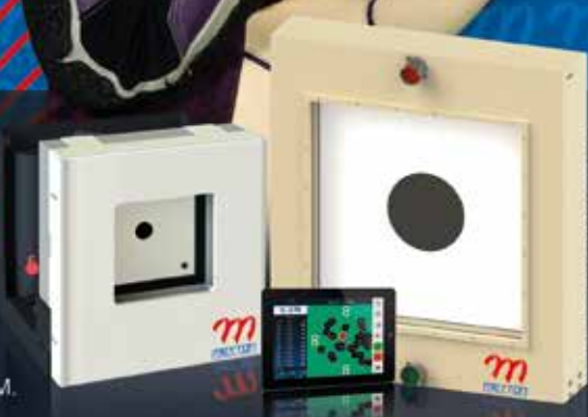
Darstellung nicht maßstabgetreu

MEYTON ANLAGEN STEHEN FÜR HOCHWERTIGE, IN DER INDUSTRIE UND IM PROFISPORT BEWÄHRTE , 100% BERÜHRUNGSGLOSE INFRAROT-MESSTECHNIK, UNSCHLAGBAR IN ALLEN DISZIPLINEN VON 10M BIS 100M.