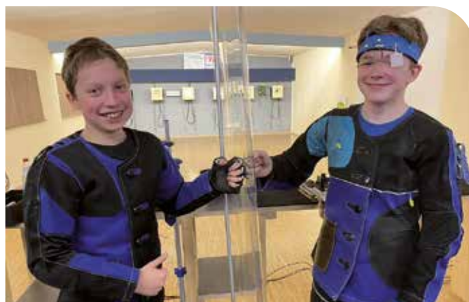
Das Team von Bad Mergentheim war auch nach dem Wettkampf in guter Laune

Damit die WSV-Vertreter auch ohne Präsenz in Ruit für die Bundesveranstaltung in München bestimmt werden können, wird der Shooty Cup im Fernwettkampf-Modus durchgeführt. Die Ergebnisse werden analog zum Vorkampf mit dem Meldeformular und Ergebnismachweis eingereicht. Landesjugendleiterin Katrin Rudau hatte die teilnehmenden Vereine auch darum gebeten, Fotos für eine Veröffentlichung in der Südwestdeutschen Schützenzeitung zu machen. Eine Auswahl dieser Fotos präsentieren wir nun nach Abschluss des ersten Teils des Fernwettkampfes. Über den zweiten Teil und die Sieger für München werden wir in der Maiausgabe berichten. (ep)