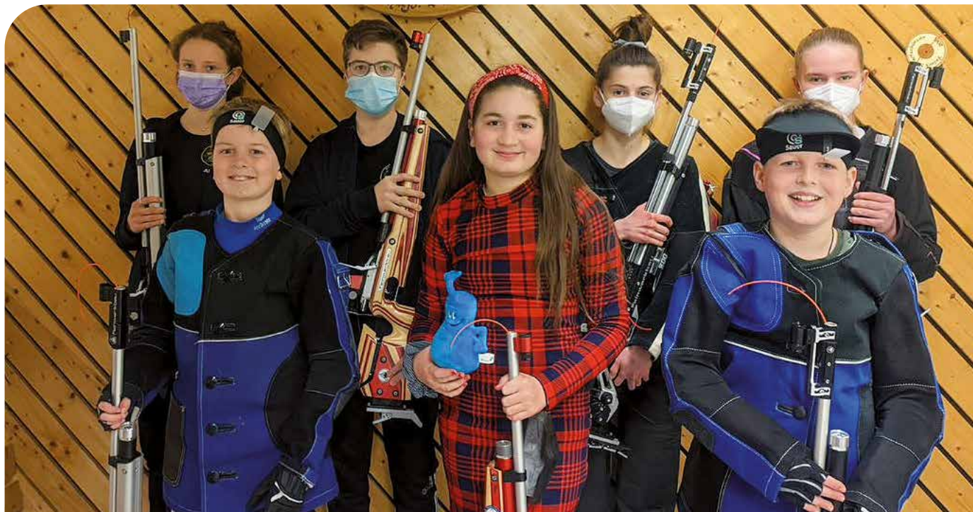
Beim Fernwettkampf, den der Kreis Neckar-Zollern durchgeführt hatte, war die Freude besonders groß. Es wurden tolle Sachpreise organisiert, die es zum Schluss für die Schießsportlerinnen und Schießsportler der drei Mannschaften des SSV Eutingen, SV Nordstetten und des SV Dettingen gab